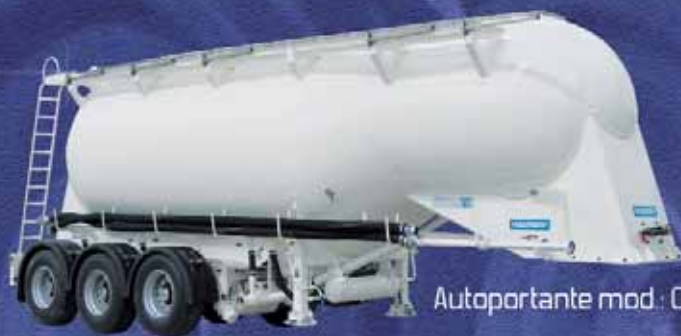
Autoportante mod. Clásico

Nuevos modelos de mayor capacidad con chasis de Aluminio de alto límite elástico, y cisternas más cortas sin tronco de cono en la parte delantera.