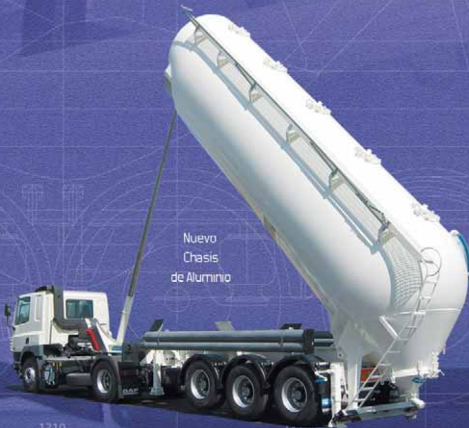
Nuevo Chasis de Aluminio

En el año 2009 DE PABLOS tras varios años fabricando cisternas a BRIAB ESPAÑOLA S.A. adquiere los derechos de las marcas BRIAB-INTERCONSULT para seguir fabricando las cisternas de esta Consolidada marca.